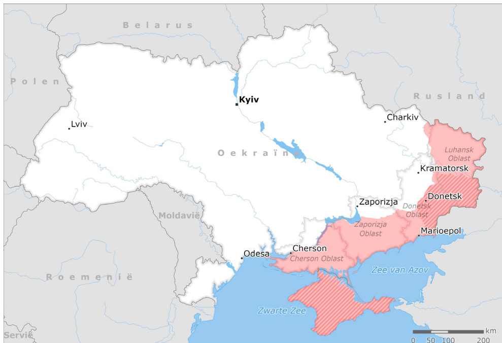
Afbeelding 1: Kaart van de door Rusland illegaal geannexeerde provincies en frontlinie medio februari 2023.

In de aanloop naar de inval beschuldigde Moskou Oekraïne, de Verenigde Staten en andere westerse landen van het voorbereiden van chemische provocaties en het in stand houden van een geheim biologisch wapenprogramma. Moskou is sindsdien niet meer gestopt met het uiten van deze beschuldigingen en gebruikt media, diplomatieke kanalen en internationale organisaties om deze boodschap kracht bij te zetten. Tevens verkondigt Moskou bij vlagen dat Oekraïne zich nucleair zou willen bewapenen, of een aanval met een zogeheten 'vuile bom' zou willen uitvoeren. Dergelijke uitlatingen missen echter een feitelijke onderbouwing.